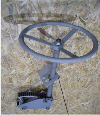
стопор в сборе